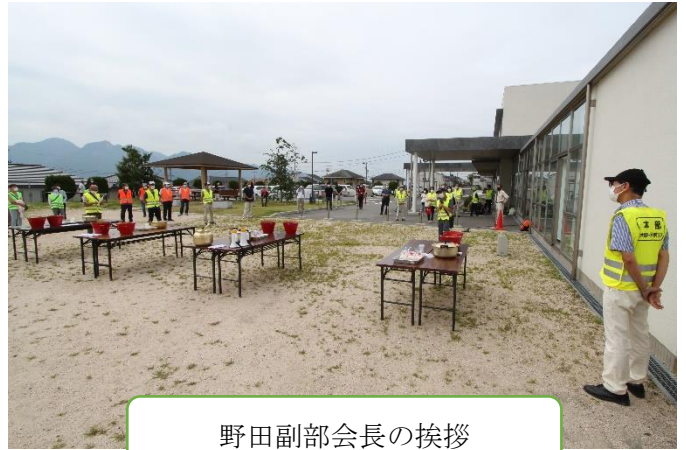
野田副部会長の挨拶