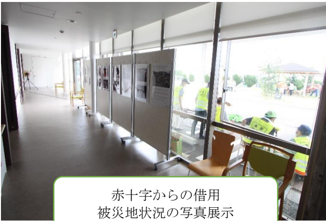
赤十字からの借用 被災地状況の写真展示