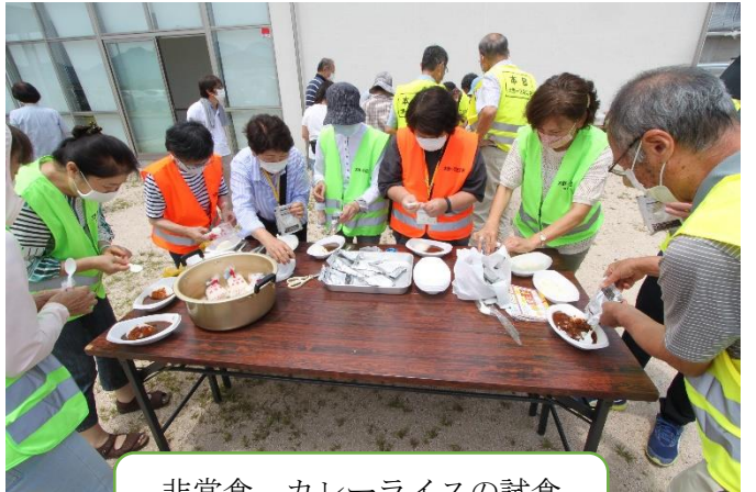
非常食 カレーライス 味付けは辛口です