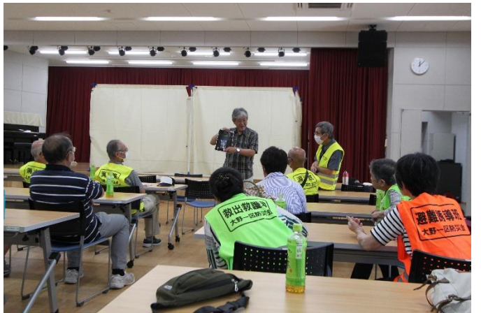
他区との情報交換