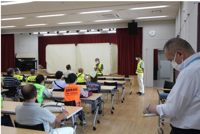
他区との情報交換