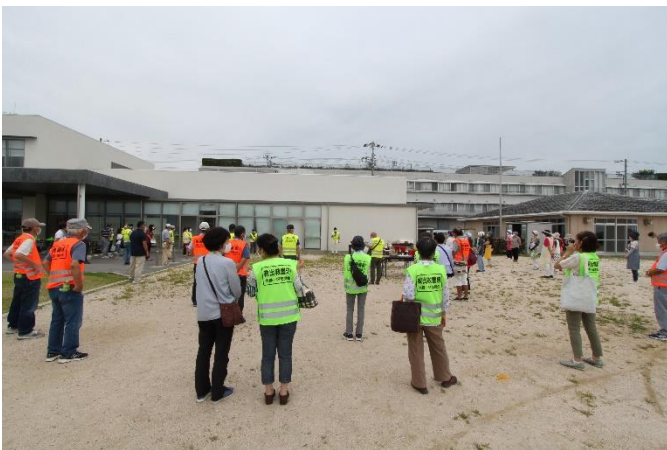
山口防災部会長の挨拶