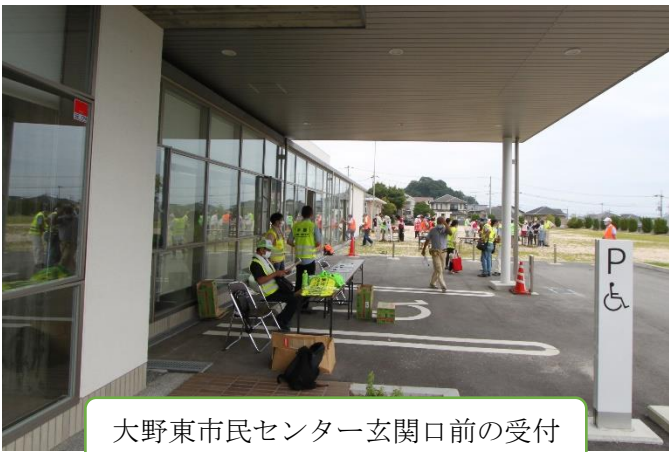
大野東市民センター玄関口前の受付