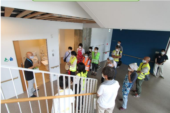
防災用シャワー室の説明