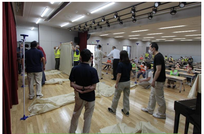
避難所の設営・仕切テントの組立て