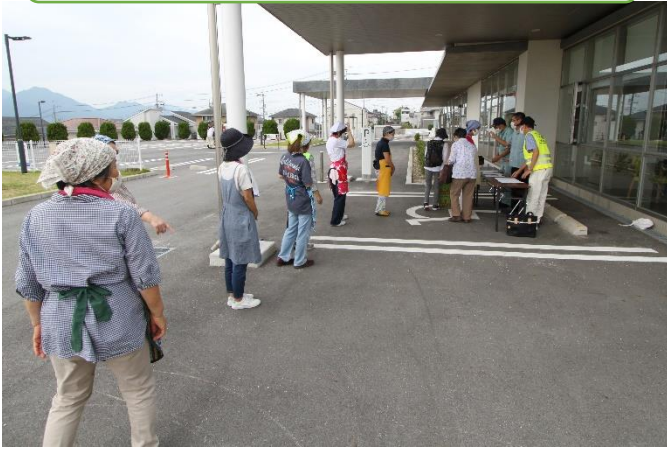
受付での参加者の確認と検温チェック