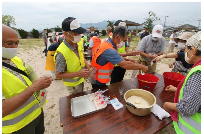
参加者による非常食体験 ハイゼックスへの米詰め